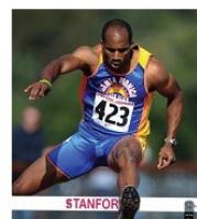
Bayano Kamani Atenas 2004 Beijing 2008