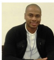
Irving Saladino Londres 2004 Beijing 2008 Londres 2012